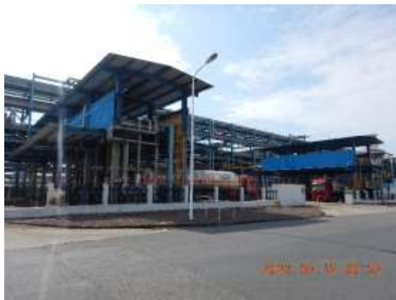
西侧的镇利化学液体化工产品装车站