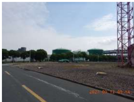
东侧的东区污水处理场