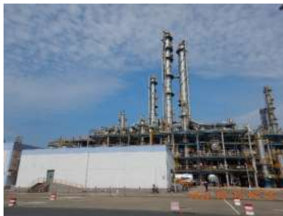
西侧的裂解汽油抽提装置