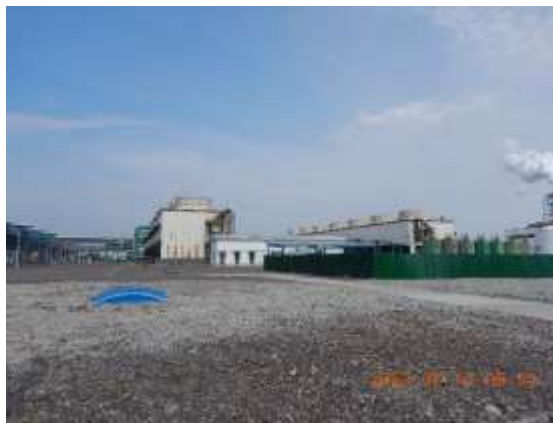
北侧的第四循环水场