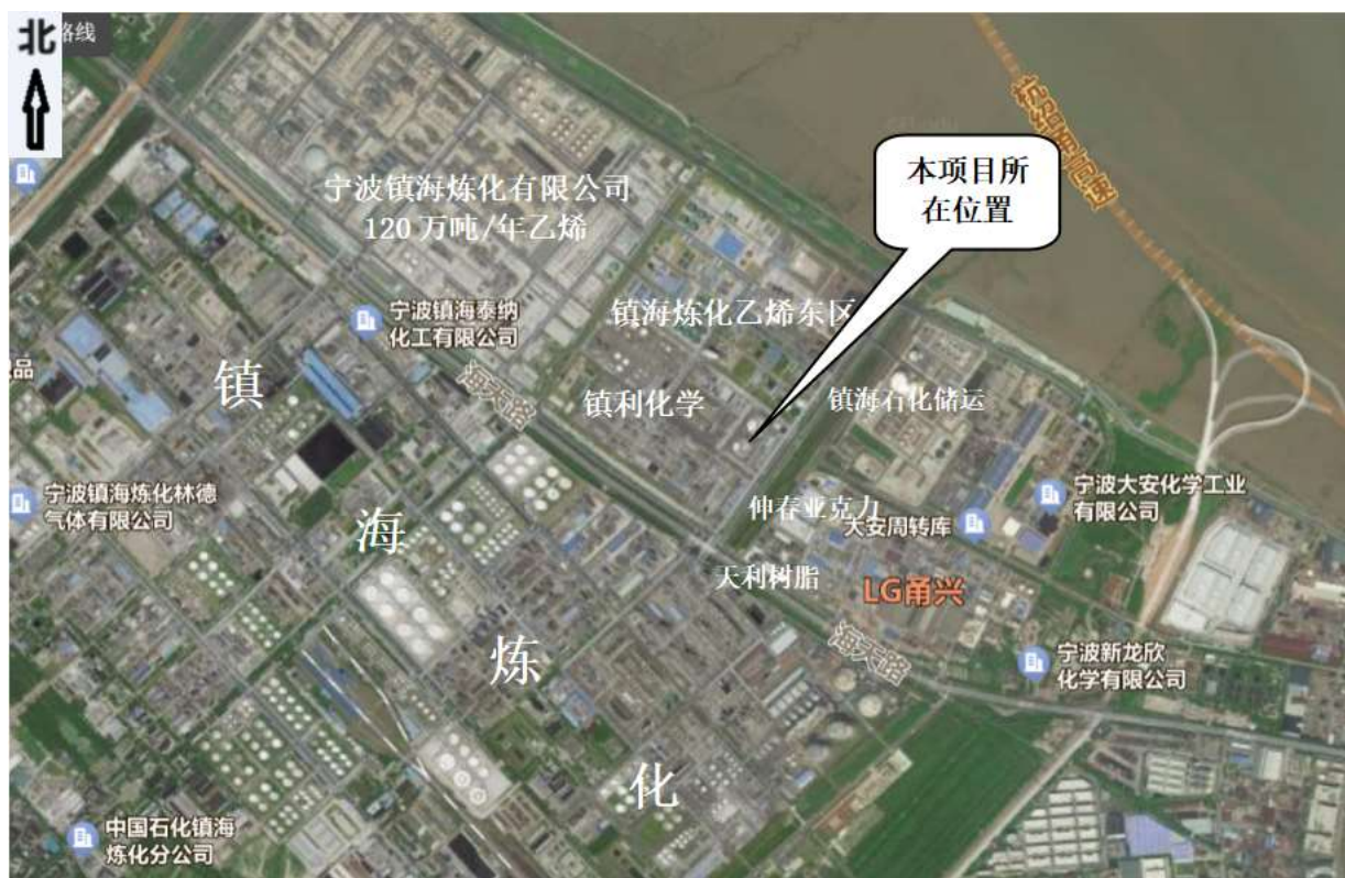
图 2-2 周边环境示意图

宁波石化开发区位于杭州湾南岸，宁波镇海区西北侧辽阔的海涂上，规划面积 43.77 平方公里。区内地势平坦，依江临海，水源充沛，环境容量大，自然条件优越，同时园区提供“九通一平”，配套设施齐全。宁波及周边地区经济的快速发展和宁波杭州湾大桥的建设给园区带来了无限商机和发展机会，具有发展石油化学工业得天独厚的优势。园区水陆交通便捷、四通八达，区域优势明显。园区距宁波市区仅 14 公里，距东方深水良港北仑港仅 24 公里，紧邻中国最大的液体化工码头。