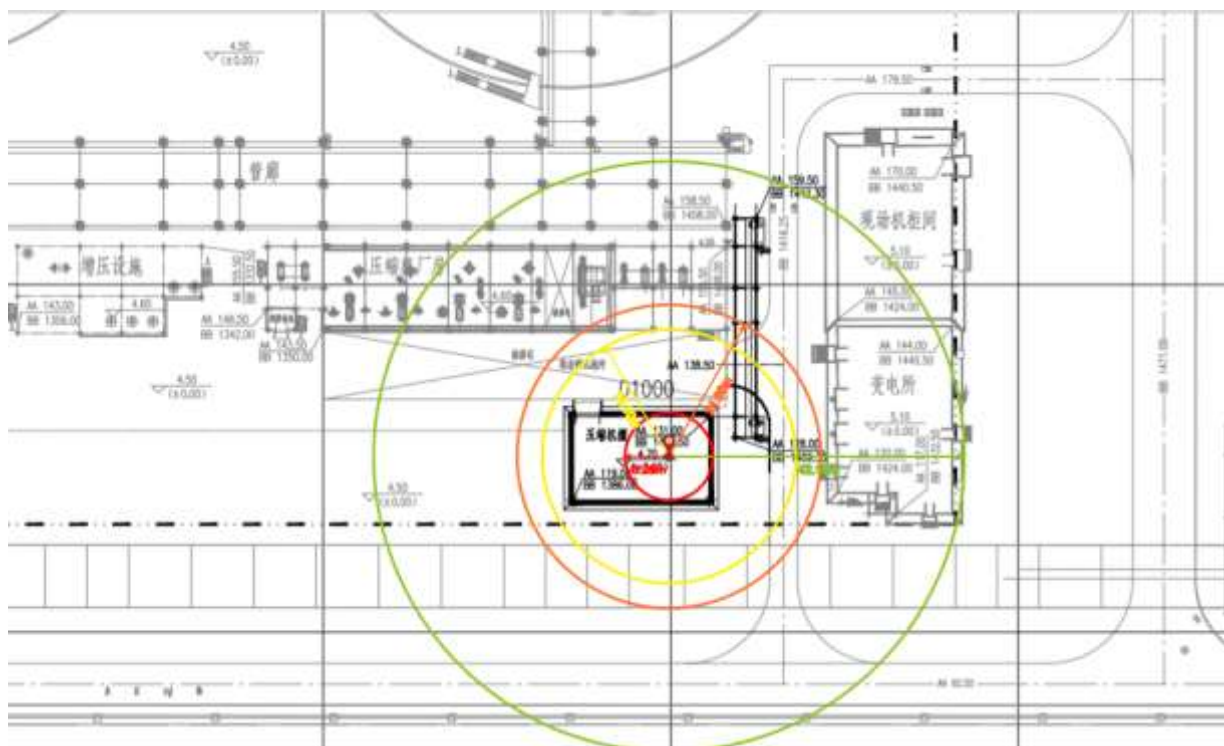
附图 3-2 乙烯压缩机乙烯泄漏蒸气云爆炸事故后果模拟图