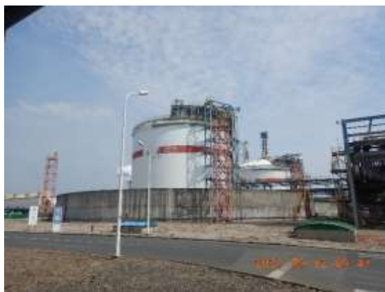
乙烯东区低温罐区现状