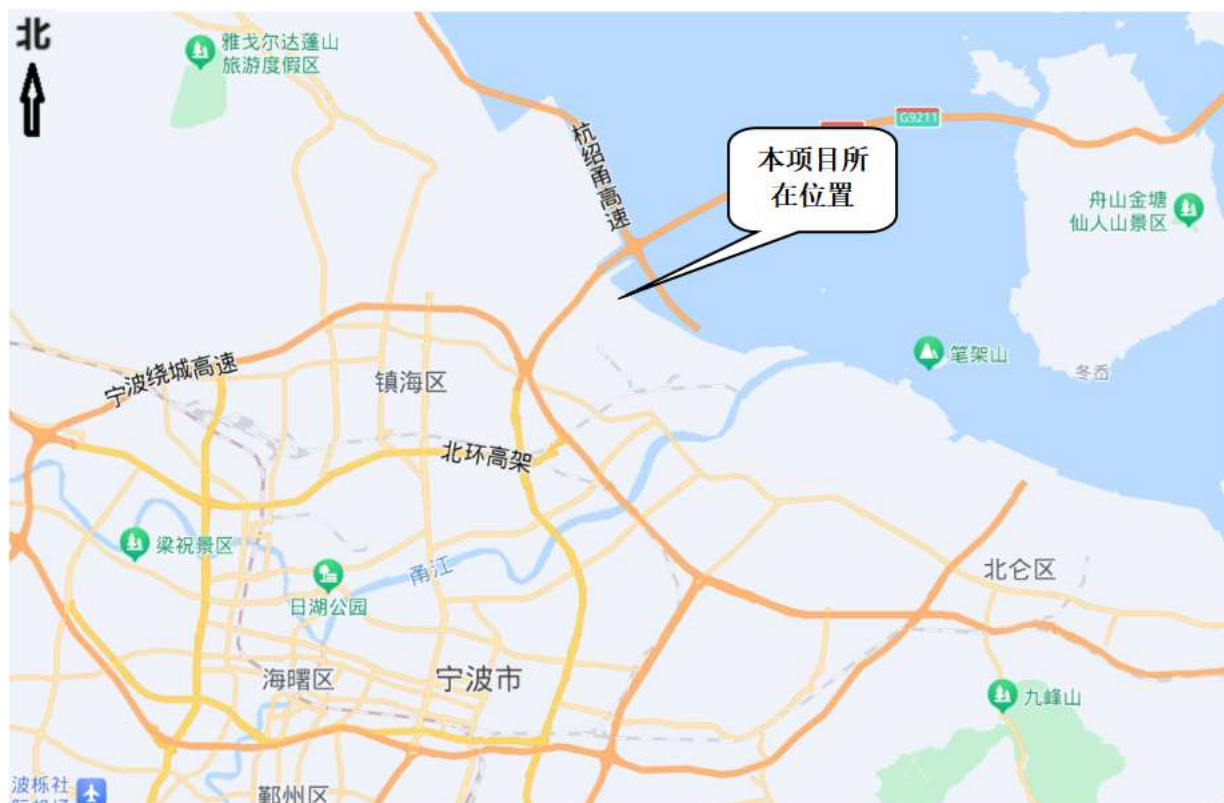
图 2-1 地理位置图

本项目位于宁波石化开发区镇海炼化乙烯东区低温罐区区域内,地理位置图、周边环境示意图如下。